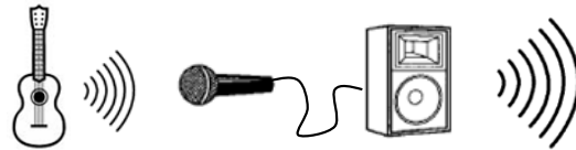
Fuente de sonido

Un sistema de sonido básico capta una fuente de sonido por medio de un micrófono y luego la amplifica por medio de un altavoz o parlante. Aquí la guitarra produce el sonido, el micrófono lo capta y el parlante lo amplifica.